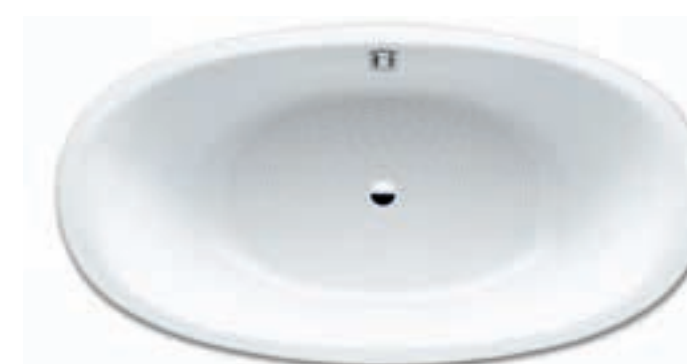
ELLIPSO DUO OVAL s celoplošným antislipem/s celoplošným antislipom