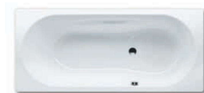
VAIO SET s antislipem/s antislipom