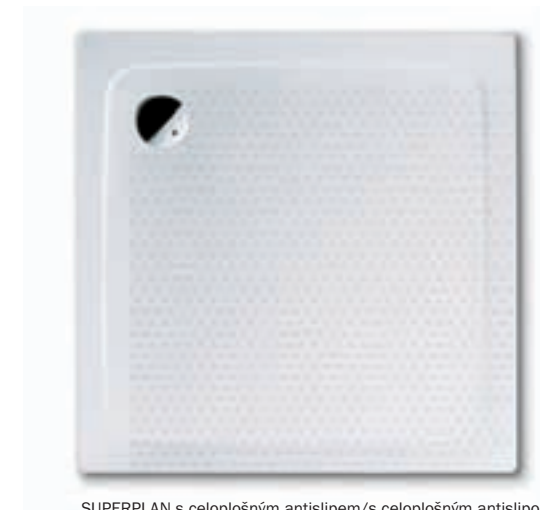
SUPERPLAN s celoplošným antislipem/s celoplošným antislipom

Protiskluzný smalt Antislip firmy Kaldewei je vyroben ze směsi křemene a písku a je pevně vtaven do smaltované oceli Kaldewei 3,5 mm. Svým strukturovaným povrchem zajišťuje větší bezpečnost při koupání nebo sprchování. Antislip se neopotřebává ani při dlouhodobém zatížení. Antislip je k dostání skoro u všech van a vaniček. Ještě větší plochu dna vany nebo vaničky pokrývá celoplošný antislip. Zkušební institut TÜV Rheinland potvrzuje, že antislip a celoplošný antislip Kaldewei odpovídají protiskluznosti B pro plochy, kde se chodí bosou nohou (DIN 51097).