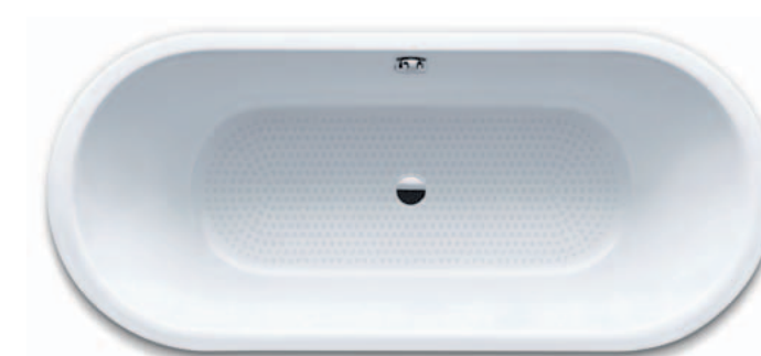
CENTRO DUO OVAL s celoplošným antislipem/s celoplošným antislipom