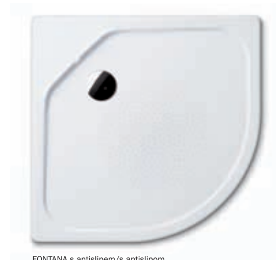
FONTANA s antislipem/s antislipom

Kto chce pri kúpaní alebo sprchovaní spojiť estetiku s bezpečnosťou, môže vybaviť svoju vaňu prisluchajúcimi madlami a svoju vaňu i vaničku protišmykovým smaltom. Vďaka rozmanitým kombináciám madiel je možné vane Kaldewei prispôbiť takmer akejkoľvek individuálnej požiadavke. Prispievajú estetickým spôsobom k ešte väčšej bezpečnosti.