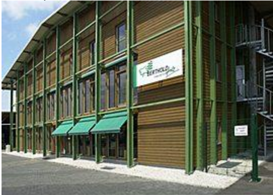
Kancelárska budova (vľavo), pick-up plocha (vpravo)