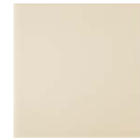
0070472 Avorio 33,3x33,3