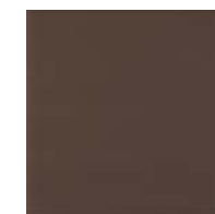
0070467 Terra 33,3x33,3