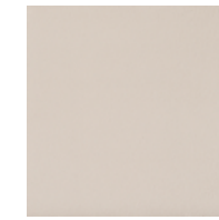
0070470 Grigio 33,3x33,3